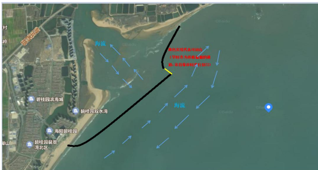
碧桂园拦截网布防图

拦截网共设置 18 千米，其中碧桂园马河港以外设置 3 千米拦截网；曦岛至黄海水产有限公司西的南北路之间设置 15 千米拦截网。采用横向拦截，竖向疏导的原则，对浒苔进行有效的拦截，对于因风浪等原因越过拦截网的浒苔引导至岸边设立的 4 集中靠岸点，有效的避免浒苔大面积靠岸，对旅游造成不利的影响。市公安局、烟台海警局海阳工作站和市海洋发展和渔业局要做好浒苔拦截网安全保障工作，发现偷盗和破坏行为，坚决予以打击。市公安局和市交通运输局负责保障浒苔运输线路畅通和车辆运输安全。市气象局负责气象预报预测，特别是海上大风的预报工作。