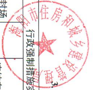
3. 海阳市住房和城乡建设管理局2021年度行政强制措施情况统计表